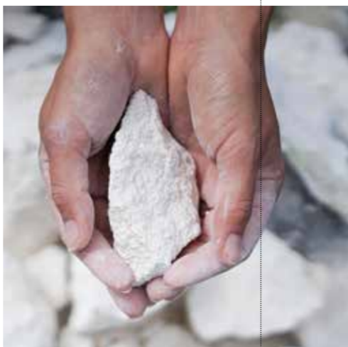
Kridt / Chalk / Kreide