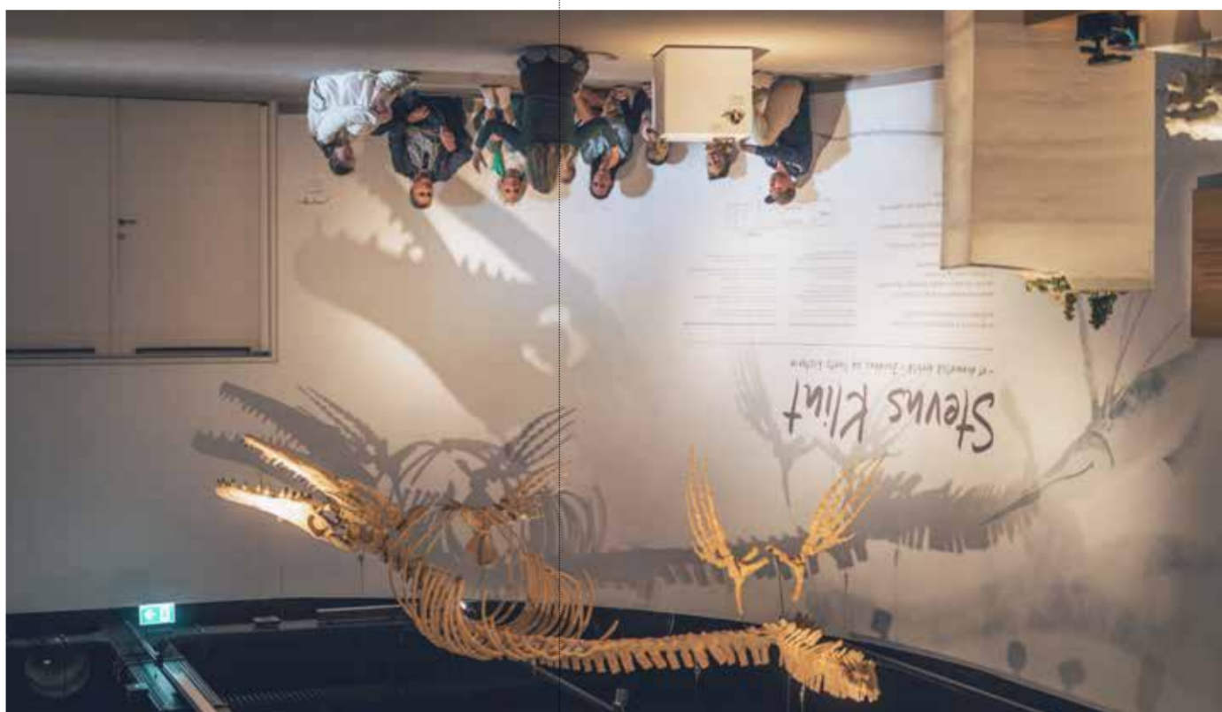
Stevns Klint Experience